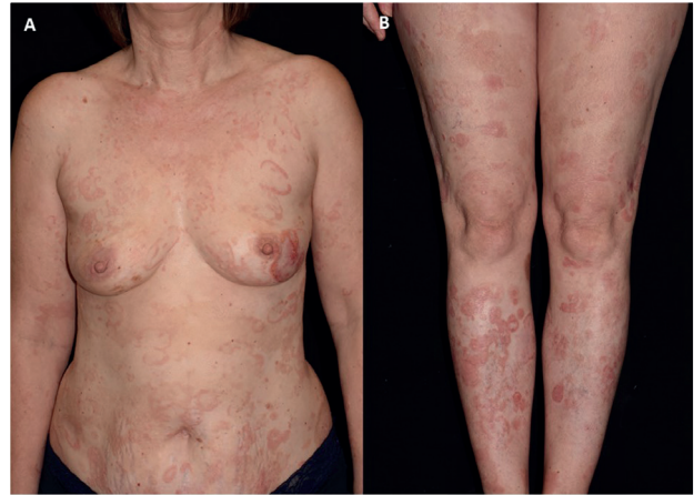
2. ábra Kezelést megelőző állapot