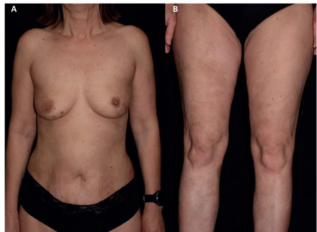
3. ábra PUVA terápiát követő állapot